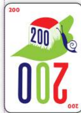
Carte de 1954

Petite anecdote : Sur les cartes, les animaux à côté de la borne 200 ont changé depuis 1954. A l'époque, c'est l'escargot qui illustre la borne 200...